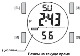
Режим на текущо време