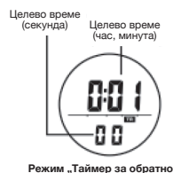
Режим „Таймер за обратно броене“